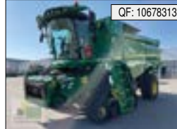
John Deere, S780i, BJ: 03/2021, BS: 1427, PS: 547, Tr.Std: 900, ATR: hydrost., ACT, BC[...], Preis auf Anfrage