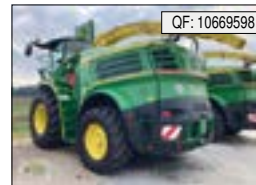
John Deere, 8500i, BJ: 2022, BS: 405, PS: 585, Tr.Std: 405, MV, PU, GGS-el[...], 359.900 € (zzgl. 19% MwSt.)