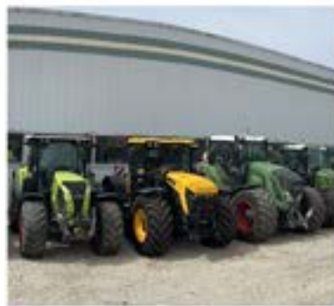
Gebrauchtmaschinen Premium Gebrauchtmaschinen geringe Stundenleistung & GMC geprüft