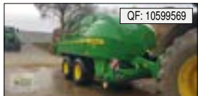
John Deere, L634, BJ: 11/2020, BZ: 3800, BK: FST, BAT: GB, Rotoc., SWF[...], 98.000 € (zzgl. 19% MwSt.)