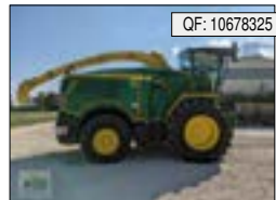
John Deere, 8600i, BJ: 06/2022, BS: 89, Ha: 180, PS: 625, Tr.Std: 35, MV[...], 445.000 € (zzgl. 19% MwSt.)