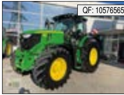
John Deere, 6250R, BJ: 2022, BS: 793, PS: 250, GT: SL, KL: Klimaaut., EHR[...], 181.900 € (zzgl. 19% MwSt.)