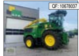
John Deere, 9900 i, BJ: 2020, BS: 1778, PS: 970, Tr.Std: 927, MV, PU, AP[...], 362.900 € (zzgl. 19% MwSt.)