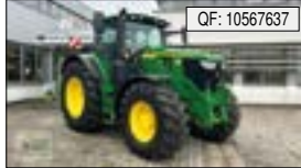
John Deere, 6R 215 6R215 mit Garantieverlängerung bis 05/2025, BJ: 2023[...], 163.900 € (zzgl. 19% MwSt.)