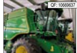
John Deere, T 560 i, BJ: 2023, BS: 344, Ha: 394, PS: 387, Tr.Std: 160[...], 289.900 € (zzgl. 19% MwSt.)