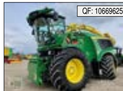
John Deere, 9900 i, BJ: 2021, BS: 1952, PS: 970, Tr.Std: 1380, MV, PU, AP[...], 399.900 € (zzgl. 19% MwSt.)