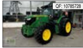
John Deere, 6135R 6135 R Reifendruckregelanlage, BJ: 2021, BS: 4645, PS: 135[...], 79.900 € (zzgl. 19% MwSt.)