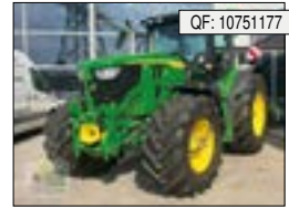
John Deere[...], 159.900 € (zzgl. 19% MwSt.)