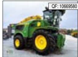
John Deere, 9900 i, BJ: 07/2021, BS: 968, PS: 970, Tr.Std: 968, AP[...], 439.000 € (zzgl. 19% MwSt.)