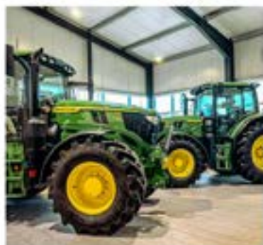
Lager- & Vorführmaschinen Lager- und Demomaschinen zu Schnäppchenpreisen