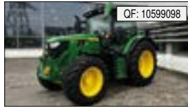
John Deere, 6R150 6R 150, BJ: 06/2023, BS: 25, PS: 177, GT: SL[...], 134.900 € (zzgl. 19% MwSt.)