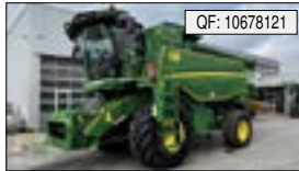
John Deere, T560 I HM, BJ: 2022, BS: 560, Ha: 890, PS: 389, Tr.Std: 322[...], 318.487 € (zzgl. 19% MwSt.)