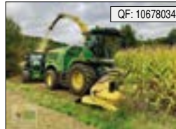
John Deere, 8400i, BJ: 2021, BS: 752, PS: 540, Tr.Std: 752, MV, PU, AP[...], 309.900 € (zzgl. 19% MwSt.)