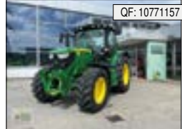
John Deere, 6110R 6110 R, BJ: 2020, BS: 1313, PS: 110, GT: SL, KL: Klimaaut., EHR, FKH[...], Preis auf Anfrage