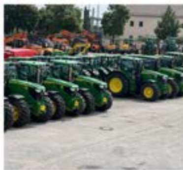
Junge gebrauchte John Deere Zertifizierte, neuwertige John Deere Maschinen Used Certified